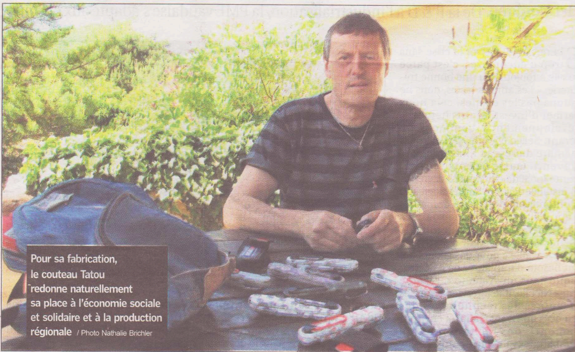
Pour sa fabrication, le couteau Tatou redonne naturellement sa place à l'économie sociale et solidaire et à la production régionale

Solidaire, équitable, sociale, la petite entreprise Tatou multiplie les innovations et les diversifications depuis 2007. La déclinaison du manche, à l'origine noir ou kaki, en décors identitaires (la Suisse, la Palestine, la Corse, les droits de l'homme, etc.), en alliage de polymères et de déchets de bois, la réalisation d'étuis en cuir importés